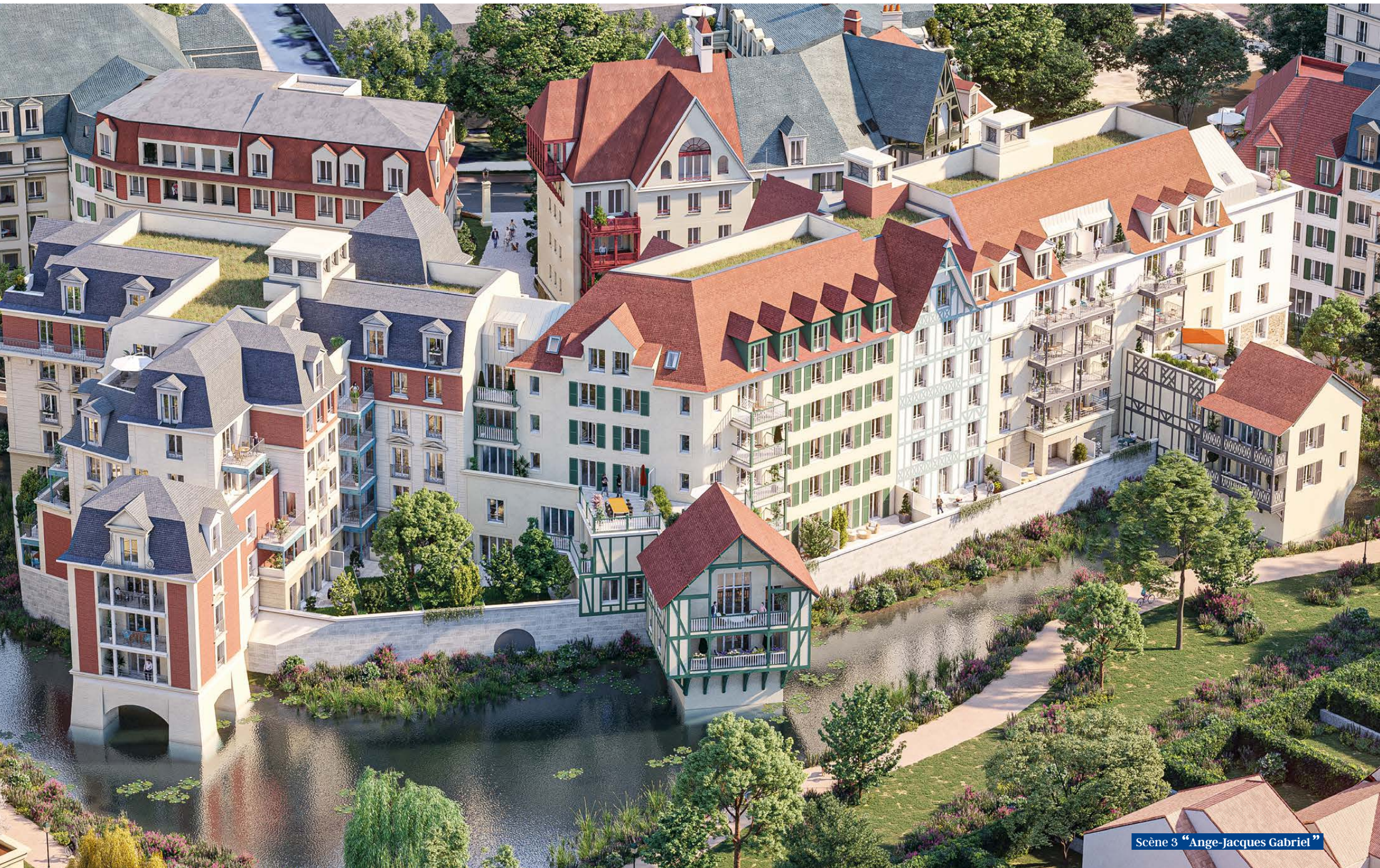
Scène 3 "Ange-Jacques Gabriel"