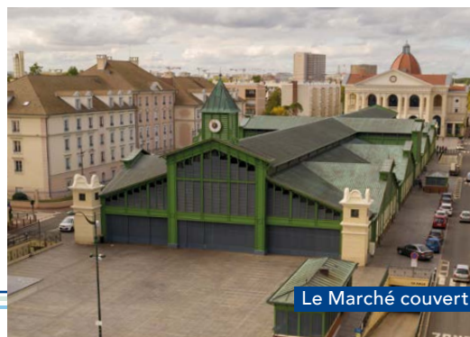
Le Marché couvert