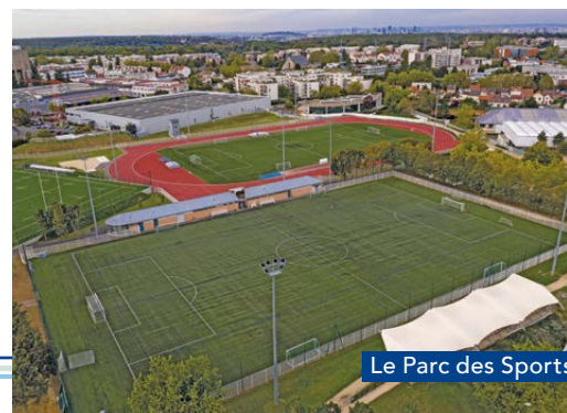
Le Parc des Sports