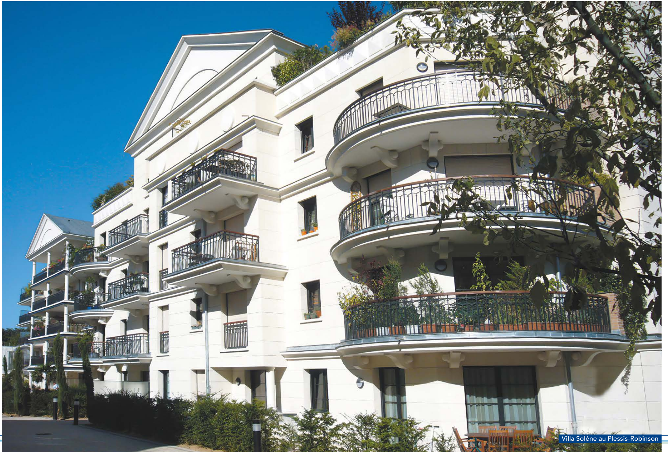
Villa Solène au Plessis-Robinson