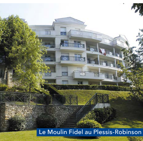
Le Moulin Fidel au Plessis-Robinson