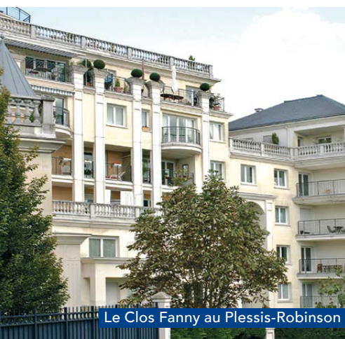
Le Clos Fanny au Plessis-Robinson

Foncier Promoteur Immobilier conçoit et réalise des projets en totale adéquation avec les attentes de ses clients et partenaires. Nos programmes contribuent à la mise en valeur de la ville tout en répondant au besoin des usagers, en leur assurant, à proximité immédiate, des services et équipements, garantissant un cadre de vie exceptionnel alliant charme et fonctionnalité .